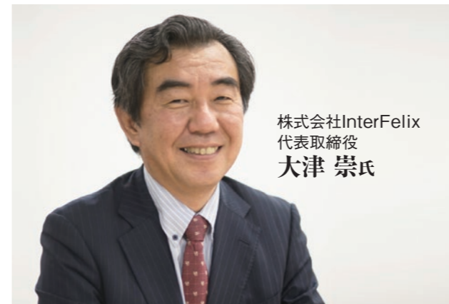
Profile ● 東京理科大学卒業。ISP草創期からのメンバーで、2013年ISP代表に就任。2016年2月インターフェリックス設立